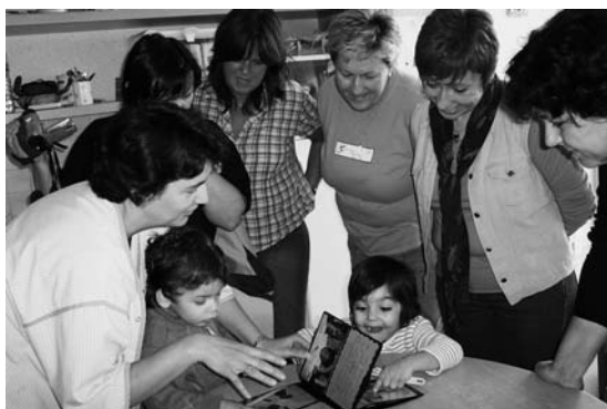
Stáž odborníků v Limoges

Projekt byl finančně podpořen z prostředků Nadace OZ