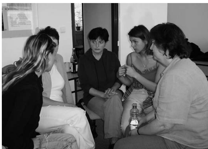
Diskuse v pracovních skupinách

úvodní seminář (realizován v roce 2005), společné multidisciplinární vzdělávání (realizace 2006–2007), odborná česko-francouzská konference (bude realizována v roce 2007).